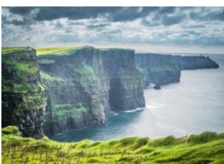
Comté de Clare