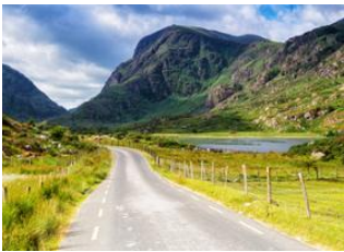
Comté de Kerry