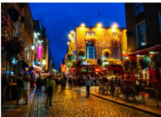
Parc National du Connemara 📍 🚗 290km - ⌚ 4h Dublin 📍