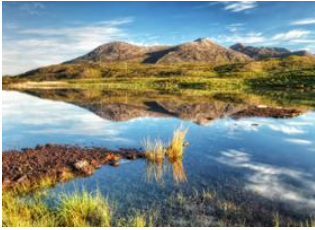
Parc National du Connemara 📍