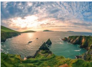
Comté de Kerry