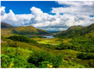
Comté de Kerry